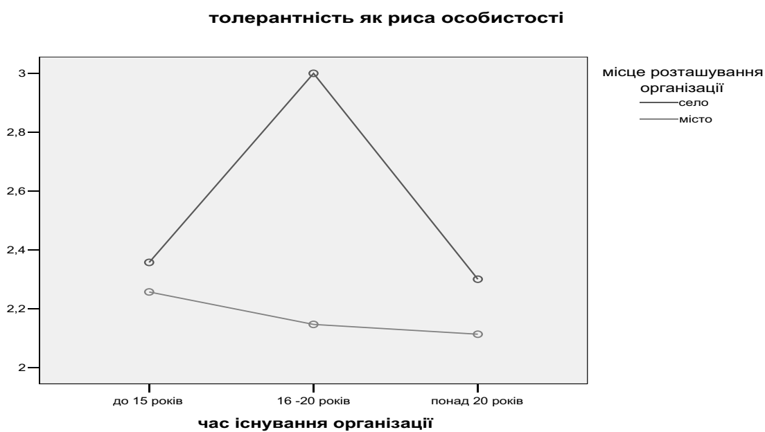
Рис. 2. Вплив чинників «час існування організації» та «місце розташування організації» на рівень толерантності як риси особистості персоналу закладів освіти ( p < 0,05 )

Встановлено сукупний вплив чинників «час існування організації» та «місце розташування організації» на рівень толерантності як риси особистості педагогічних працівників. Як видно з рис. 2 , в міських навчальних закладах рівень толерантності педагогів зі збільшенням часу існування організації дещо знижується, тоді як у сільських навчальних закладах він спочатку зростає, досягає максимуму для часу існування організації від 16 до 20 років, а потім стрімко знижується.