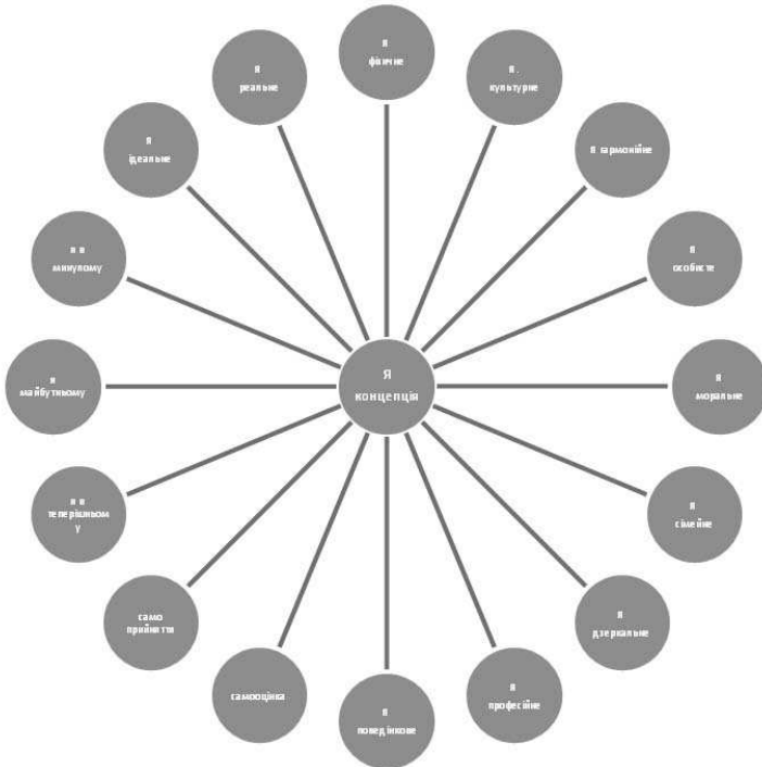
Рис. 2. Модель сумарних уявлень у структурі Я-концепції (статичний аспект). (Елемент авторської проєктивної методики дослідження Я-концепції (див. СЕДНОР +)

Виходячи з означених досліджень ми спробували побудувати інтегративну модель Я-концепції у статичному аспекті (див. рис. 2), а також представити проєктивну методику дослідження Я-концепції, діагностичним скелетом якої є пропонована нами схема.