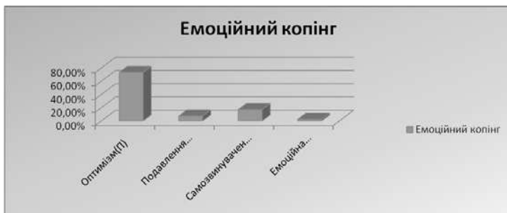
Рис. 3. Емоційні стрес-долаючі стратегії

Непродуктивні копінг-стратегії також мають місце в житті досліджуваних, оскільки бувають випадки недостатності знань, умінь, внутрішньої стабільності та зовнішньої підтримки. Залежно від індивідуальних особливостей непродуктивні стратегії проявляються в когнітивній сфері (розгубленість – 2,4%, покірність з тим, що трапилось – 2,4%), в емоційній сфері (пригнічення емоцій – 7,3%, втрата контролю над емоціями – 2,5%), в поведінковій сфері непродуктивні копінг-стратегії проявляються в активному уникненні вирішення проблеми (7,3%) та відступу від ідеї вирішувати життєві труднощі (4,9%).