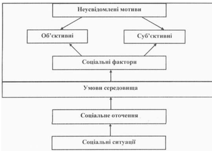
Рис. 2. Механізми формування протиправної поведінки

збільшення проблем пов'язаних з психічним та емоційно-вольовим розвитком.