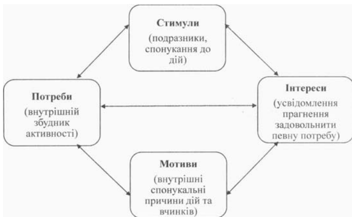
Рис. 1. Формування мотиву особистості

Вивчення мотиваційної сфери дає можливість виявити та пояснити причини, що зумовлюють асоціальну поведінку, виявити механізми формування протиправної поведінки, що, в свою чергу, є важливою умовою подолання соціальних відхилень. В. Кондрашенко підкреслює, що мотивація є специфічною формою суб'єктивного відображення об'єктивного середовища, в якому функціонує і діє особистість. Мотивація девіантної поведінки відображає не тільки асоціальну ситуацію, але і весь попередній негативний вплив соціального середовища, який сформував особистість з антисоціальною спрямованістю [1].