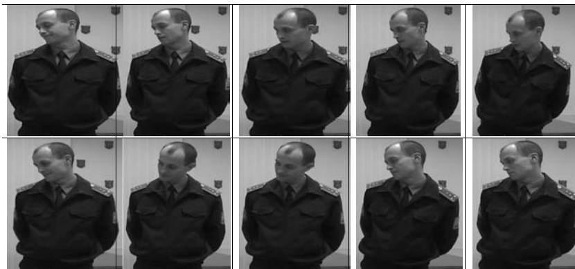
Рис. 1. Міркування досліджуваного під час розв'язування задач без жестового використання

готовності до дії ("Або ракета так летить"; "Фрагмент голубого неба, що виглядає із-за хмар" та ін.). В другому відеопротоколі жестикуляція відсутня, а мовленнєве описання зведено до рівня поняття (Рис. 1).