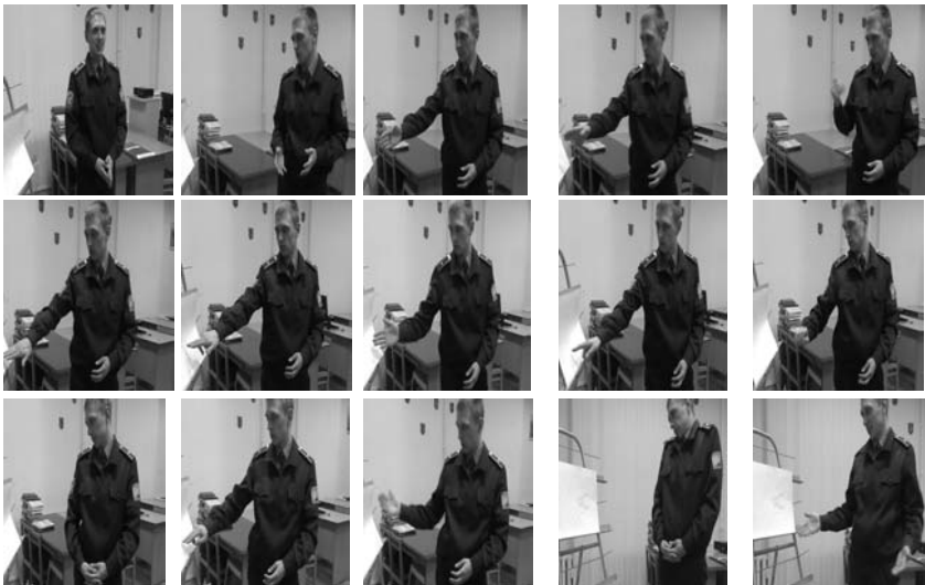
Рис. 2. Міркування досліджуваного під час розв'язування задачі з викорис-танням жестів