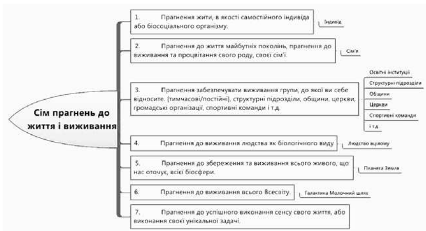
Рис. 2. Сім прагнень до життя і виживання

Під душею тут мається на увазі безсмертна складова людини. Якщо Ви не вірите в своє безсмертя або хоча б у те, що маєте безсмертну складову, будь ласка, поставтеся з розумінням до оман автора. Окремі неточності не знецінюють тих частин тексту, з якими ви погодитеся і які зможете використовувати для покращення свого здоров'я.