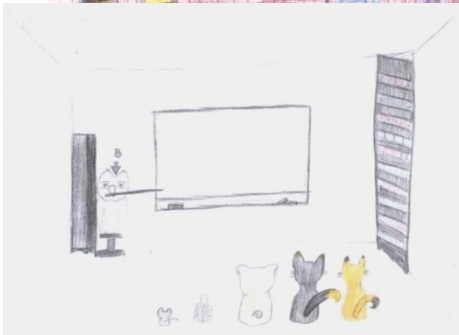
Мал. 2. 3 Зображення дошки на проективному малюнку «Школа звірів»

Висновки: Проведене емпіричне дослідження виявило зв'язок між навчальною успішністю підлітка і станом тривожності. Зокрема, виявлено достатньо високий рівень залежності підлітка від оцінок зовнішнього середовища, що часто провокує деструктивне реагування – підвищену тривожність, страх, неспокій. Особливо загрозовою для підлітка є ситуація перевірки знань, в якій підліток стає центром уваги і знаходиться в очікуванні негативних реакцій з боку