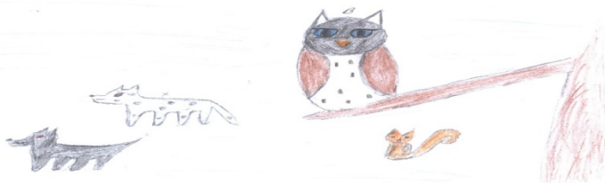
Мал. 1. Проєктивний малюнок «Школа звірів»

Зокрема виявлено, що характер стосунків з вчителем найчастіше демонструє дистантну форму взаємодії. На жодному з малюнків нема близького контакту з вчителем, натомість на 25% малюнків «учні» зображені спиною до «вчителя». Водночас, прослідковується тенденція: низька успішність учня часто супроводжується відсутністю вчителя на малюнку, або ж відсутністю взаємодії з ним. Для прикладу, малюнок 1 (автор: Влад К, середній бал успішності 5,9).