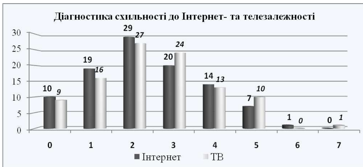
Рис. 2. Схильність юнаків і дівчат до Інтернет- та телезалежності (у %)

За допомогою методики «Шкала Інтернет-залежності» та опитувальника «Діагностика схильності до телезалежності» нами отримані такі дані. На Рис. 2 представлено розподіл відповідей випробуваних відповідно до набраних ними балів. Отримана сума позначена на горизонтальній осі, а відсоток юнаків і дівчат, що отримали цю суму, – на вертикальній.