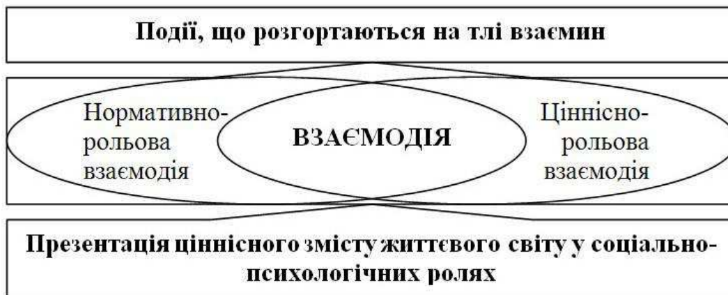
Рис. 3. Інтерсуб'єктне творення взаємин

Другий напрямок аналізу – дослідження міжособистісних взаємин не лише в її суб'єктному осмисленні, а й в інтерсуб'єктному творенні (Рис.3).