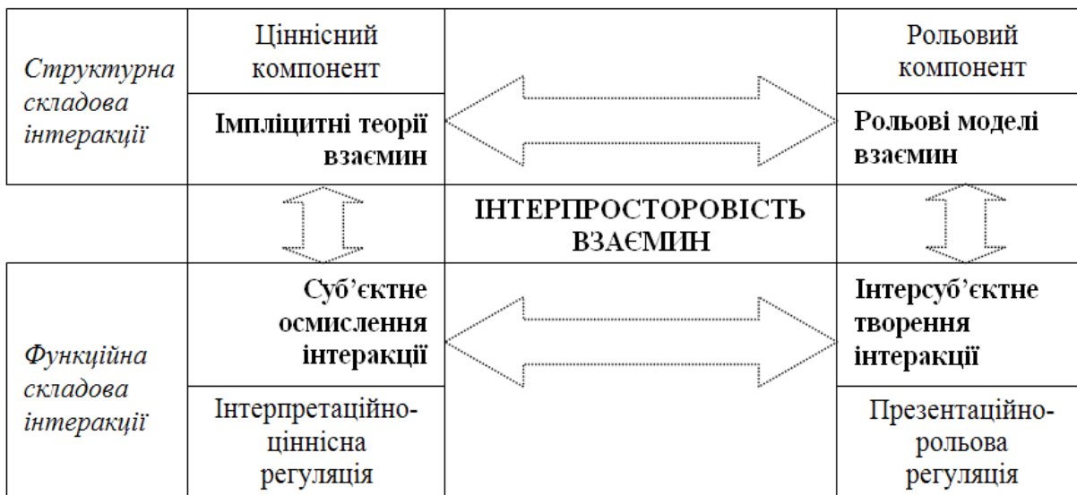
Рис. 1. Узагальнена модель ціннісно-рольової інтеракції

перехідну між зовнішнім та внутрішнім світом частину дійсності, яка "... існує завдяки нашій свідомості, але не в нашій уяві, а в міжособистісному інформаційному полі" [2, с. 17]. В нашій моделі цією складовою є інтерпросторовість взаємин , специфічне інтерпросторове середовище, що твориться та розгортається у життєвих світах, де, власне, і формулюються ціннісні закони взаємин та розгортається інтеракція.