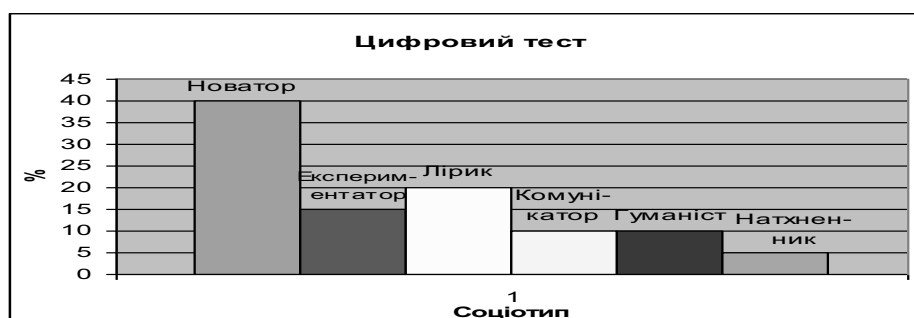
Рис. 1. Результати дослідження визначення психосоціотипу респондентів

З метою визначення психосоціотипу творчої особистості, використовувався цифровий тест «Соціотип» Мегеля – Овчарова, отримані результати: 40% – Новатор (Інтуїтивно – логічний екстраверт), 20% – Лірик (Інтуїтивно – логічний інтроверт) 15% – експериментатори (Логіко – інтуїтивний екстраверт), 10% – Комунікатор (Етико – сенсорний екстраверт), 10% – Гуманіст (Етико – інтуїтивний інтроверт), 5% – Натхненник (Інтуїтивно – етичний інтроверт). Таким чином, можна зробити висновок, що до експериментальної групи увійшли респонденти з перевагою інтуїтивно-логічного психосоціотипу, який характеризується здатністю збирати інформацію довільним чином вбачаючи в ній сенс та знаходячи взаємозв'язок з різними явищами, довіряючи інтуїції, також властива добре розвинена уява та допитливість, що є характерним для творчих особистостей (75%) (див.Рис.1).