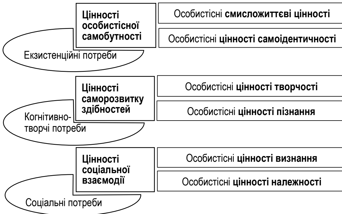
Рис. 2. Класифікація особистісних цінностей обдарованої людини з позицій потребового підходу

Для дослідження аксіогенезу обдарованої особистості важливо зацентувати увагу на тих особистісних цінностях, які пов'язані саме з розвитком обдарованості. У проведених раніше дослідженнях нами було виокремлено три групи потреб, які виконують особливу роль в аксіогенезі та мають специфічне наповнення в обдарованої особистості: соціальні, когнітивно-творчі та екзистенційні потреби [5]. У процесі задоволення цих потреб формуються особистісні цінності, класифікацію яких наведено на рис. 2.