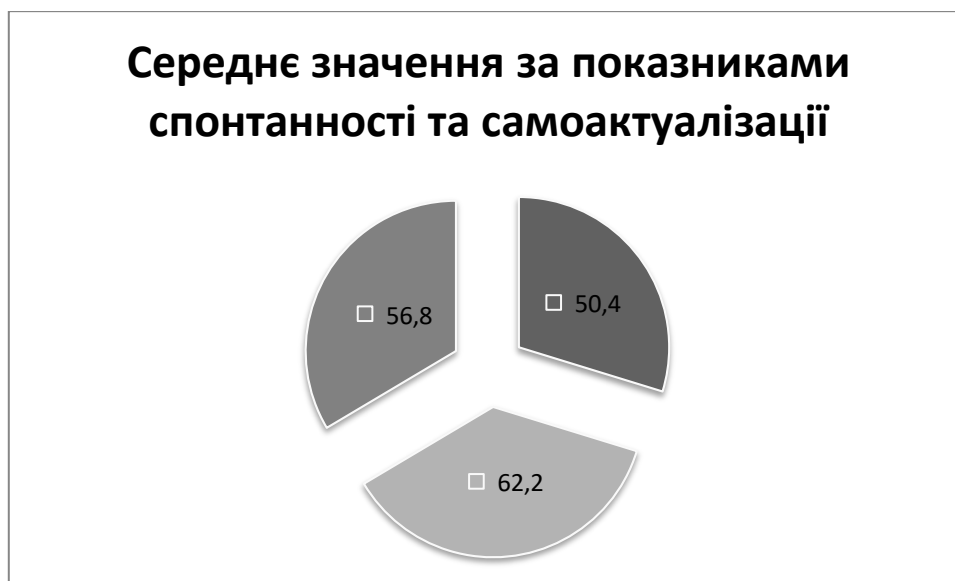
Рис. 2. Результати за показниками спонтанності та самоактуалізації

Згідно з результатами дослідження найвищі показники прагнення до самоактуалізації (>60%) пересікаються з високим рівнем спонтанності по шкалам обох використаних методик. Середнє значення показників прагнення до самоактуалізації дорівнює 56,8 %, тоді як середній показник спонтанності за методиками САМОАЛ та Собчик – 50,4% та 62,2% відповідно. Результати подано на рис. 2.