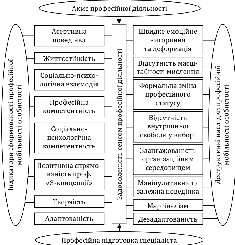
Рис. 2. Змістові характеристики сформованості / несформованості професійної мобільності особистості