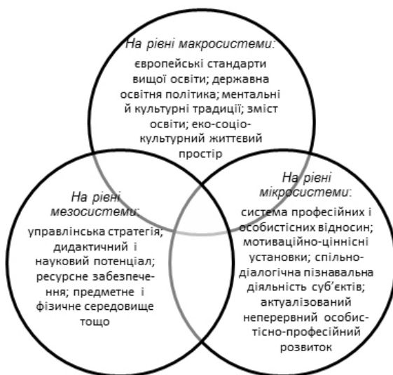
Рис. 2. Складові й особливості екологічності освітнього середовища вищого навчального закладу

потенціал; ресурсне забезпечення; предметне і фізичне середовище тощо. Таку систему формують суб'єкти освітньої діяльності, кожен з яких виконує власні професійні функції і докладає зусиль для досягнення спільного продуктивного результату, готовий до змін, інновацій, конструктивного діалогу, рефлексивного реагування на актуальні запити і потреби. Таким чином, на нашу думку, саме відкритість, динамічність, варіативність і діалогічність є ключовими особливостями екологічності освітнього середовища вищого навчального закладу, які сприяють його неконфліктному включенню в життєве середовище майбутніх фахівців, дозволяють розширювати діапазон їхнього суб'єктивного досвіду в часовій перспективі. Адже, на думку, А. Львовичкіної „екологічною буде така взаємодія, що створює „двосторонню домовленість” для розвитку всіх значущих системостворюючих компонентів системи” [8, с. 192].