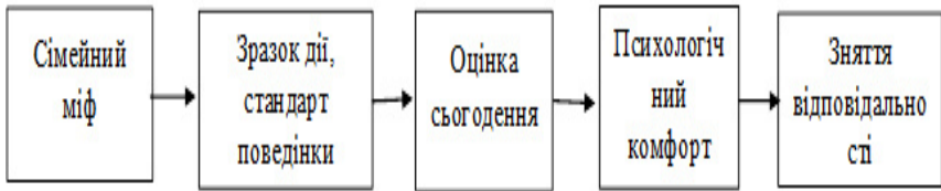
Схема 2. Послідовність дії міфологічної свідомості

Методи дослідження дозволили проаналізувати особливості функціональності сімейного та соціокультурного міфу. Суть міфу як антропологічного феномену полягає в тому, що він є первинною формою усвідомлення світу і безпосередньо впливає на соціалізацію особистості. Як з'ясувалося, сімейний міф подібно соціокультурному грає суттєву роль в первинній соціалізації людини на різних етапах її розвитку за умов своєї функціональності. У творах респондентів чітко висвітлюється специфіка сімейного міфу і полягає в тому, що висловлює потреби та інтереси особистості і як цілісна форма виконує наступні функції: соціалізуючу, нормативну, ціннісну, комунікативну, пізнавальну, організаційну, цілеутворюючу, світоглядну, моделюючу, соціально-практичну та соціально-компенсаторну. Таким чином, можна констатувати, що сімейний міф виконує схожі функції з соціокультурним але займає значне місце в індивідуальній свідомості кожного члена сім'ї. Міфи забезпечують специфічну в кожному конкретному випадку координацію сприйняття і поведінки, що в свою чергу формує ідентичність індивідів у сімейній системі та реалізується через цінності і норми між членами сім'ї та суспільством. Кожен міф формує навколо себе свій власний простір, що надає особистості єдність мислення і дій. Також його значення ще полягає в тому, що він може сприяти встановленню гармонійним взаємодіям між членами сім'ї та суспільством в цілому і таким чином забезпечує внутрішню згідність в організації життєвого простору особистості.