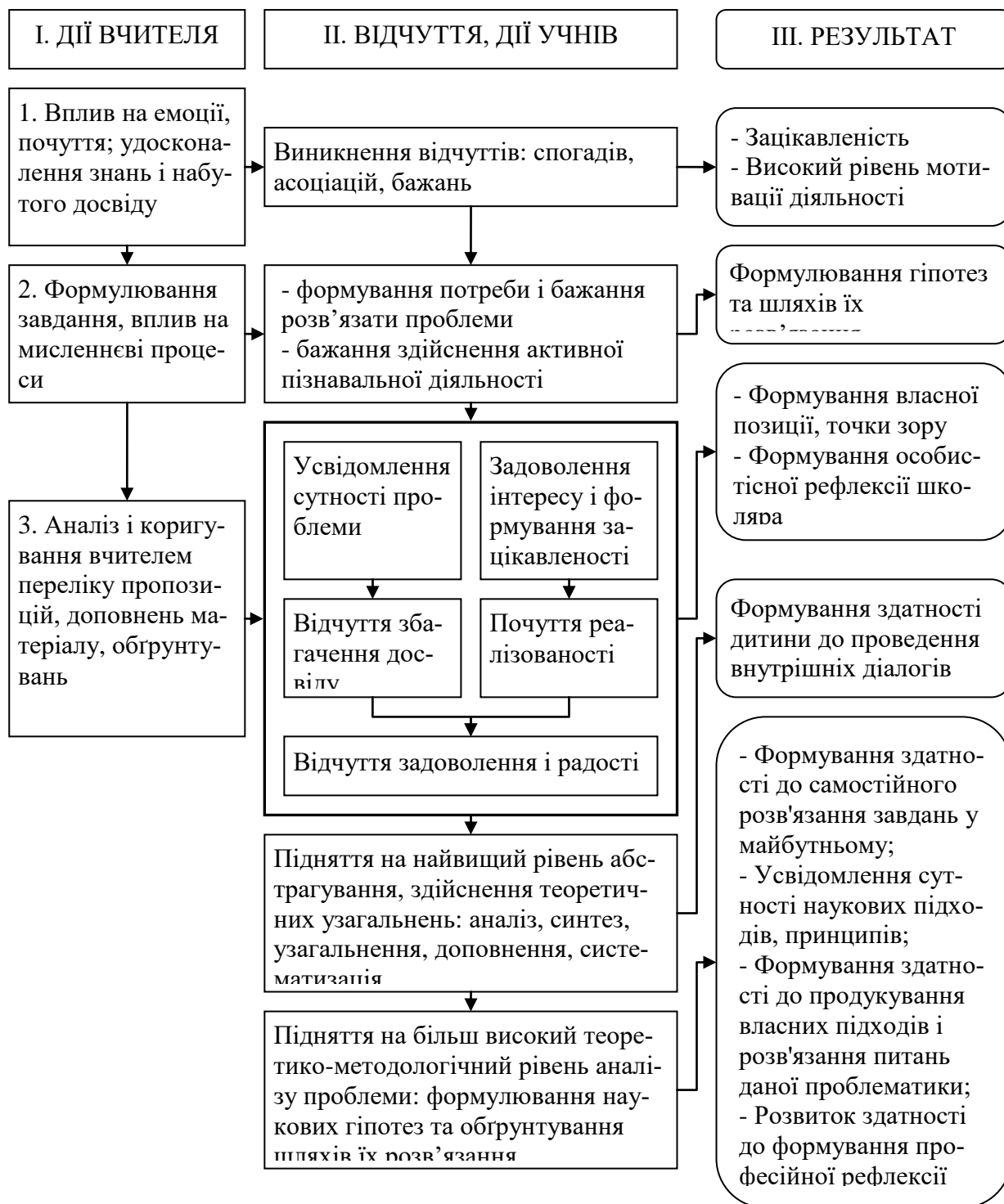
Рис. 2. Фасилітативна модель опанування учнями іноземною мовою

знавальної діяльності на уроках. Головною функцією вчителя на даному етапі є обґрунтувати для учнів всі можливі рекомендації, які формуються у процесі вивчення навчального матеріалу.