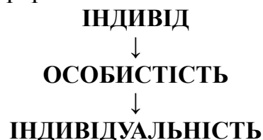
Рис. 2 Ієрархічні зв'язки індивід-особистість-індивідуальність [2]

Б.Г.Ананьєв вважав, що основою індивідуальності є неповторний комплекс певних природних властивостей індивіда. Хоча, за його словами: «не всякий індивід є індивідуальністю». Щоб стати індивідуальністю індивід повинен стати особистістю. Ієрархічні зв'язки можна представити (рис.2).